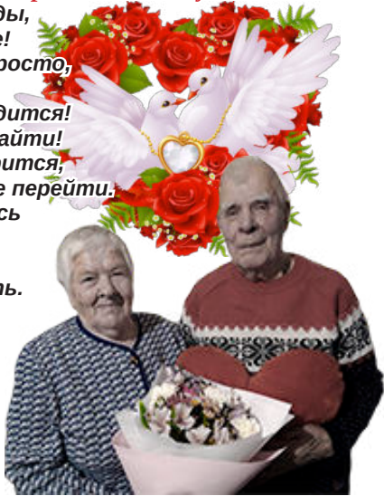
С любовью дети, внуки, правнуки

Ваш брак благословили звезды, Вам дав согласие и терпенье! Ваш подвиг повторить не просто, Он вызывает восхищенье! По праву вами вся родня гордится! Прекрасней пары в мире не найти! Недаром ведь в народе говорят, Что жизнь прожить - не поле перейти: Хоть морщинки лиц коснулись И давно седеет прядь, Вы прекрасны, как и прежде, Вместе вы шестьдесят пять. Восхищаемся любовью, Что сквозь годы пронесли, Пожелаем вам здоровья, В счастье чтобы дни текли. Радуют пускай вас внуки, Правнуки кружат вокруг. Никогда не отпускайте Своих нежных, верных рук.